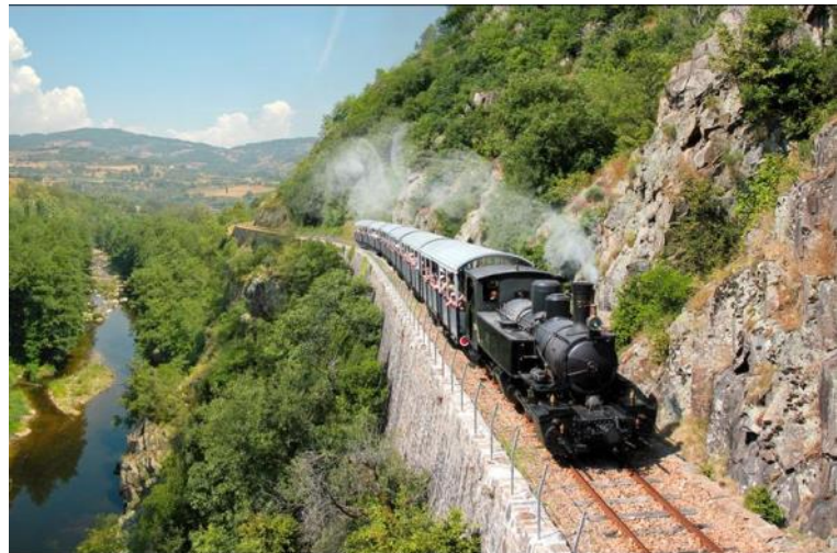
Train de l'Ardèche et Dolce Via

Une escapade de deux jours pour découvrir une Ardèche authentique et sauvage au cœur du Vivarais !